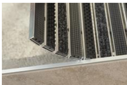
Individuell kombiniert: Fußmatten aus dem „Duraway“-Programm von Dural.

Die neue „Duraway“-Broschüre kann kostenlos beim Hersteller angefordert werden: Dural GmbH, Südring 11, 56412 Ruppach-Goldhausen, Tel. 02602/9261-0, Fax: 02602/9261-50, E-Mail: info@dural.de