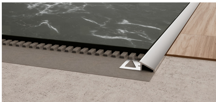
DTAE TR 125