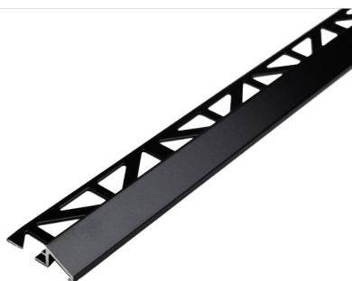
DTACM TR 1211